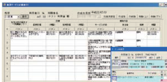
※1) 施設サービス計画書

メディスプラン(施設版)では、利用者さまのニーズや目標を、モニタリングから施設サービス計画(※1)へと反映させることができます。メディスプラン(居宅版)では、利用者さまが、どの施設でどのようなサービスを受けたのかが確認でき(※2)、ケアプランを簡単に作成することができます。